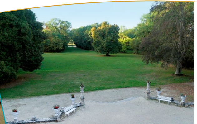
Vue sur le parc