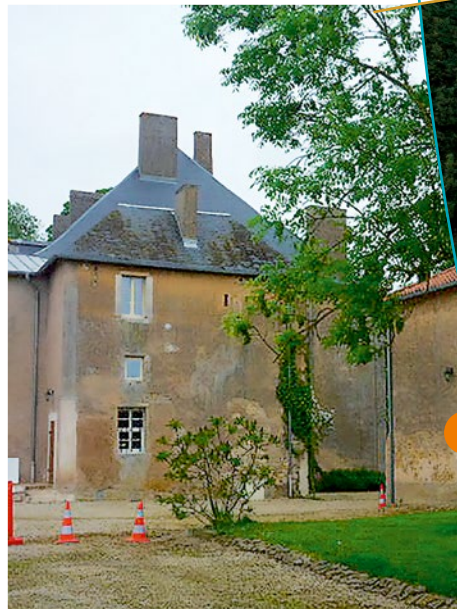
Aile Ouest du château

Le château se compose d'un corps central important à deux niveaux d'habitation, flanqué de deux bâtiments en retour sur la cour d'entrée. Ces deux bâtiments sont à usage de dépendances. La composition du parc est faite sur les principes du jardin à l'anglaise.